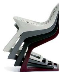
2008: Konstantin Grcic

Aus der verbindung von design und hightech ist die kultur des industriezeitalters hervorgegangen; und auch die wissenschaftsgesellschaft der zukunft wird ohne sie nicht auskommen. Rasierapparate und radios, designklassiker, wie sie Dieter Rams für den elektrogerätehersteller braun entwarf,