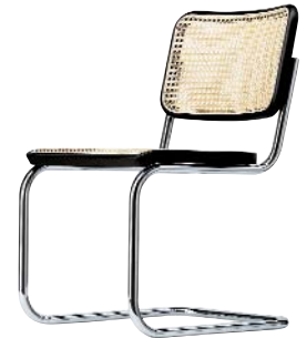
1930: Marcel Breuer