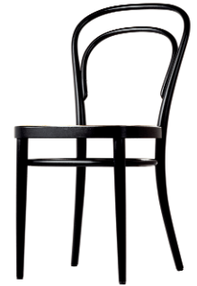
1856: Michael Thonet

wurden ganz einfach gebraucht, ebenso wie die rote reiseschreibmaschine valentine von Ettore Sottsass oder der panton-stuhl , jener plastikfreischwinger aus einem guss, der als ein zeitzeichen der siebziger jahre des vorigen jahrhunderts in die geschichte eingegangen ist. Er hat unterdessen zahlreiche nachkommen mit immer besseren materialien bekommen, den letzten, die bislang leichteste adaption mit dem namen myto von Konstantin Grcic, im frühjahr diesen jahres auf der mailänder möbelmesse. Da gutes design form und funktion verbindet, müssen die designer alles nutzen, was die aus-