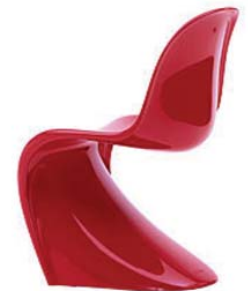
1970: Verner Panton

sicht funktionaler verbesserung eröffnet. Kunststoffe, unbrennbare materialien zum beispiel, neue lichttechniken oder bespannungen, die von sich aus leuchten, sind immer auch eine gestalterische herausforderung. Dass man sich darauf wieder stärker besinnen will als in den jahren des postmodernen abschwungs, ist ein versprechen für die zukunft, eine kreatives signal, das beste vielleicht.