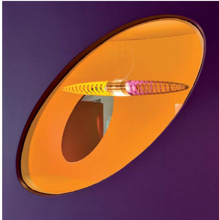
... bis zur realisierung ...