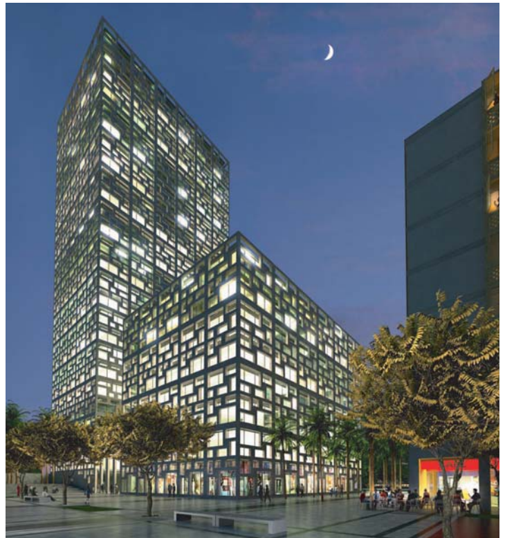
tripoli gate. tripolis/libyen. hochhaus bei nacht

Gemeinsam mit meinhard von gerkan, dem architekturbüro gmp hamburg + berlin, hat die spielmanns group den planungsauftrag für drei neue fußballstadien in libyen erhalten. Alle zusammen sollen sie einmal 200.000 zuschauern platz bieten. Auftraggeber ist das staatliche bauunternehmen ladico; die bausumme beträgt 800 millionen